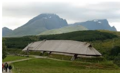
vikingahus hittad på nätet