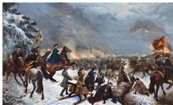
I inkarnationen som soldat under Carl den 12:e föll han under Poltavaslageret sommaren 1709